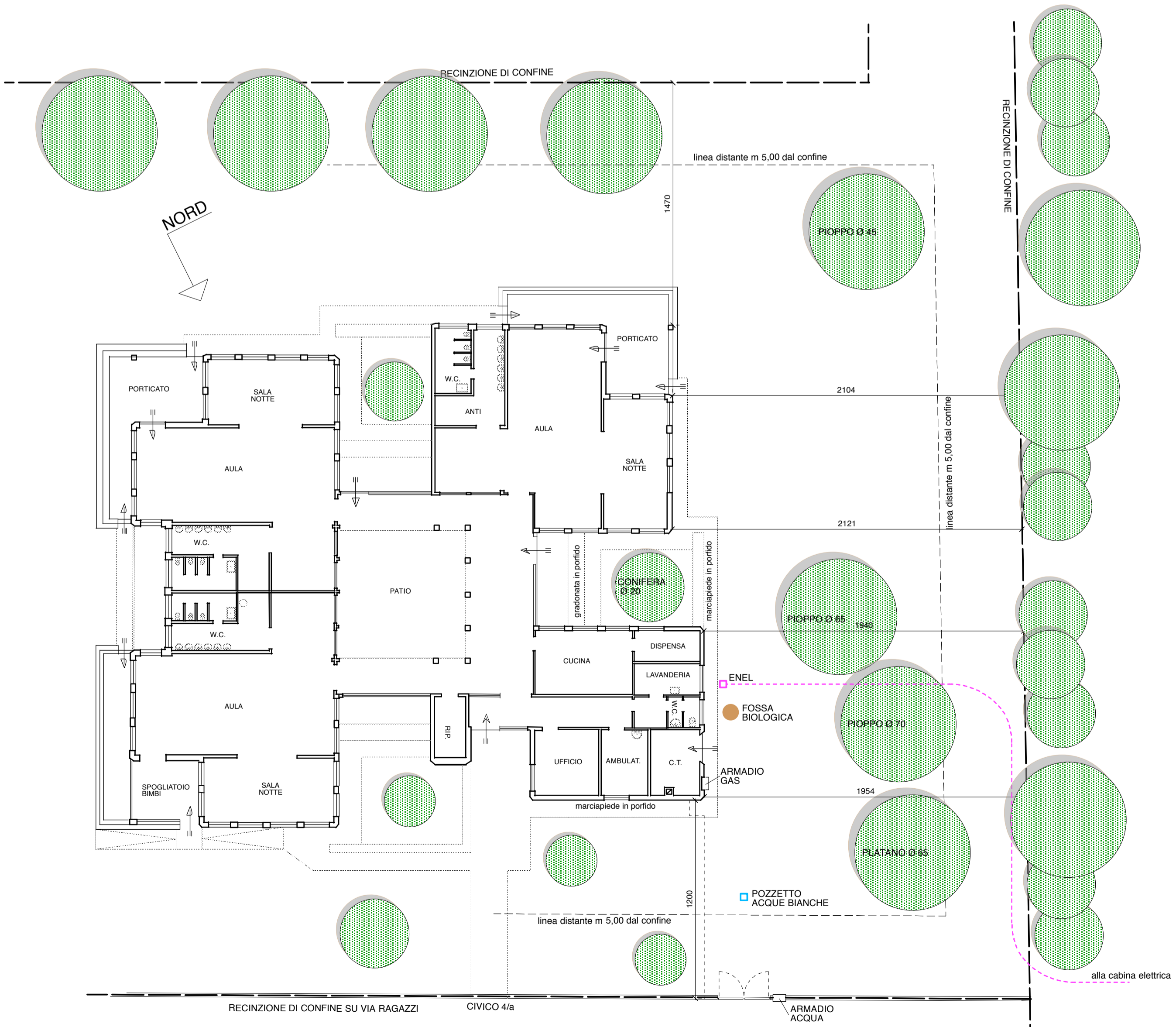
PLANIMETRIA GENERALE - STATO DI FATTO SCALA 1: 200